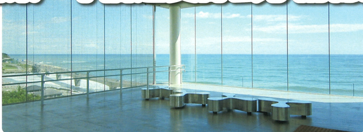
日立駅から太平洋を望む